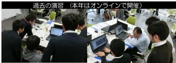
過去の演習（本年はオンラインで開催）

本講座ではサイバーレンジと呼ばれるサイバー攻撃防御演習システムを用いた演習を行います。このサイバー演習に理想的な環境をベースとして本講座向けに作成したシナリオを用いた実践的な演習を中心に実施します。本学の講座の特色として、「攻撃手法」から防御技術を学ぶことに重点をおいた演習です。