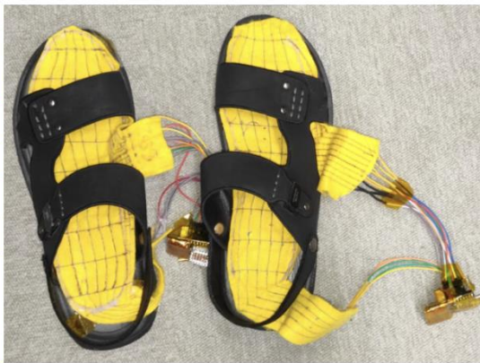
中敷センサを靴に入れて