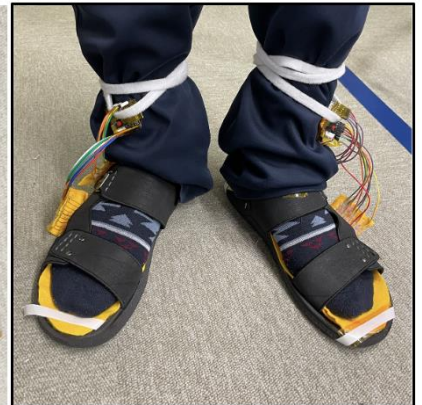
何かに活用できるか？