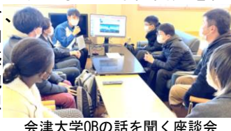
会津大学OBの話をする座談会

2023/3/20にアルプスアルパイン株式会社いわき事業所で先端技術見学会が行われ、16名の学生が中国開発を含む海外事業展開の説明を聞き、事業所見学をしました。参加学生から「先端技術を肌で感じることができて、とても勉強になりました」などの感想があり、大好評でした。