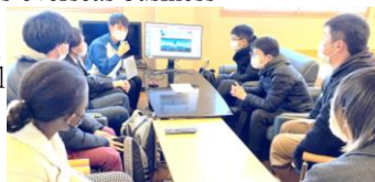
Roundtable for Hearing from UoA Alumni

On March 20, 2023, a cutting-edge technology tour was held at the Iwaki Plant of Alps Alpine co., Ltd., where 16 students listened to an explanation of the company's overseas business developments, including its development in China, and toured the plant. The event was very well received by the participating students, who commented, "I learned a lot from experiencing cutting-edge technology firsthand."